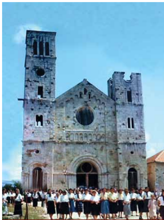
Iako je crkva na Širokom Brijegu znatno oštećena, nije ubijen duh vjernoga puka. (Snimljeno 1956.)

Uz nabrojeno u prošloj školskoj godini u ovoj je školskoj godini za nabavku novih pomagala utrošeno 945 dinara.