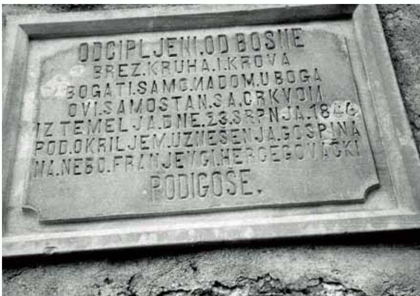
Natpis na Franjevačkom samostanu na Širokom Brijegu koji su komunisti otukli 1947.

Ostale zbirke (glazbena, fizikalna, kemijska) iste su kao i u prošloj školskoj godini. 3