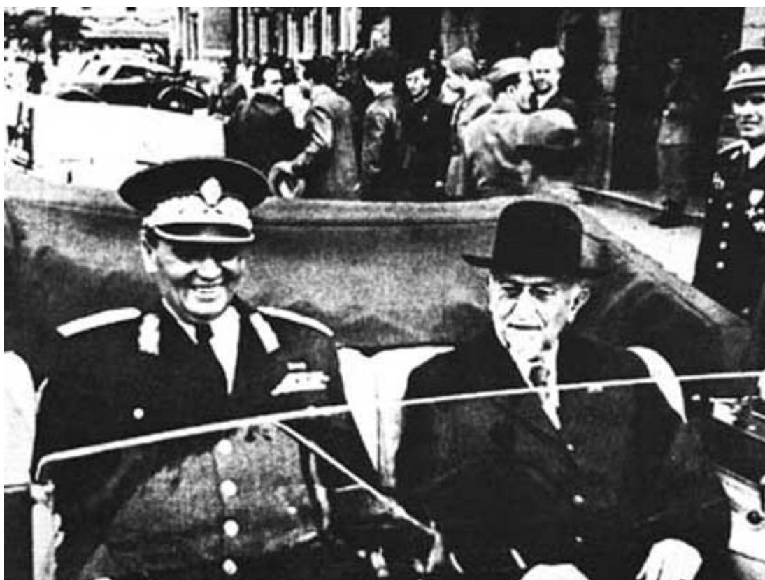
Josip Broz Tiro i Vladimir Nazor