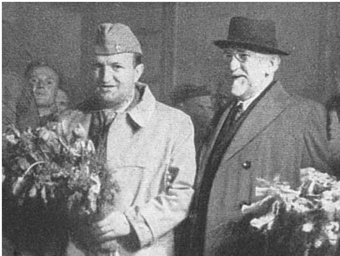
Vladimir Bakarić i Vladimir Nazor

Miroljubivi odnos između srbsko-fašističkih četnika i komunista je za razumjeti. Komunisti, uglavnom Hrvati, bježali su iz gradova u šume nakon Hitlerovog napada na Staljinov Sovjetski savez 22. lipnja 1941. Pridošli komunisti su bili u manjini i htjeli ne htjeli morali su se podrediti srbsko-fašističkoj četničkoj većini. To im nije padalo teško jer su se obadvoji borili za Jugoslaviju, a ideologiju su prepustili vremenu. Povezivala ih je i zajednička borba protiv Nezavisne Države Hrvatske.