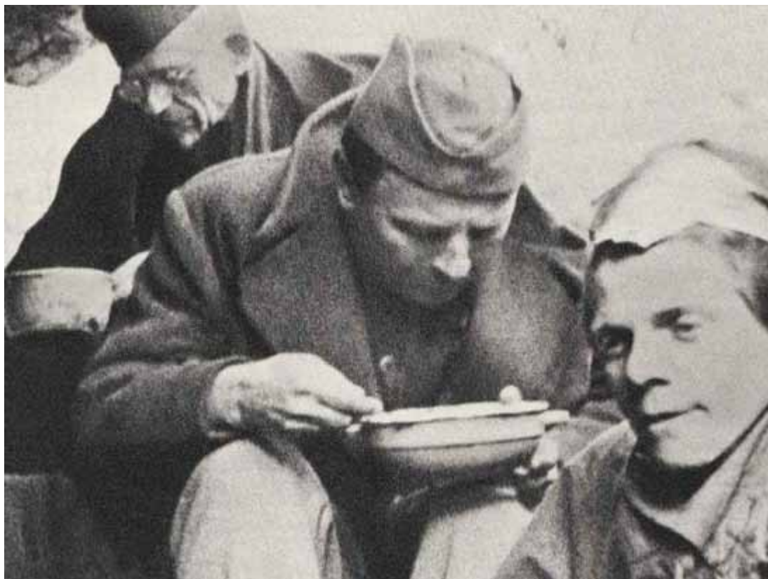
Ivan Goran Kovačić među partizanima